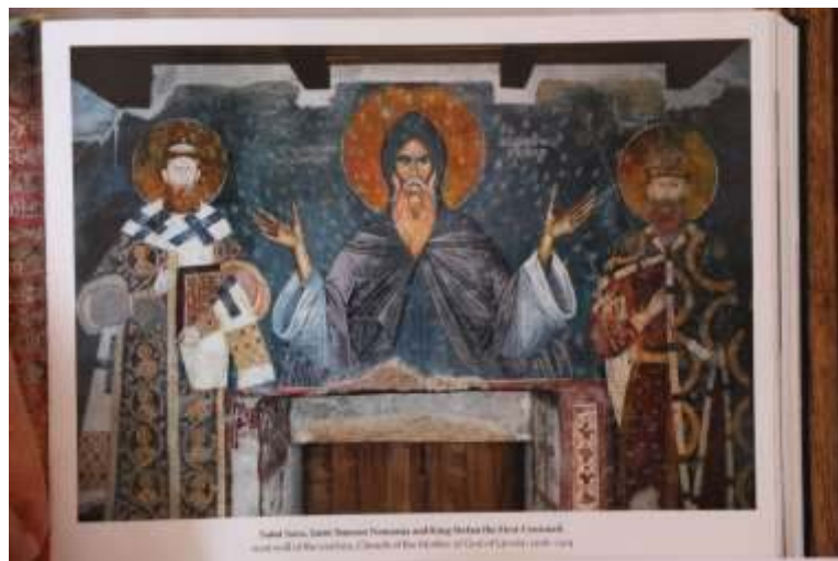
Saint Sava, Saint Siméon NEMANJA et le roi Stéfan dit « le premier couronné »