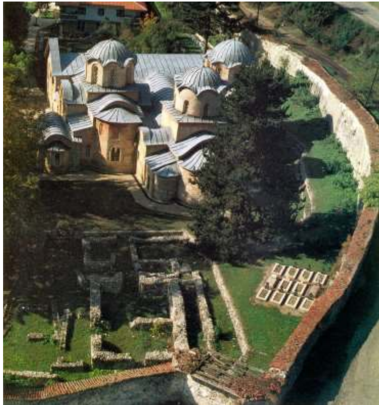
Peç – siège historique du Patriarcat de l'Eglise de Serbie